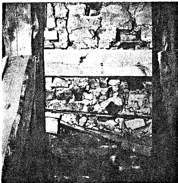
I stuetagen var brandmurens murværk knust og forskubbet mere end 7 cm.