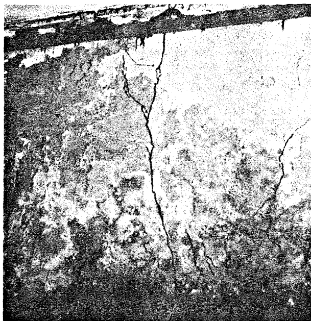
Brandmuren var i kælderen gennemkrydset af 3 mm brede revner og delvis knust.